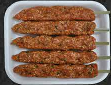
Adana kebab Adana kebab Adana kebab