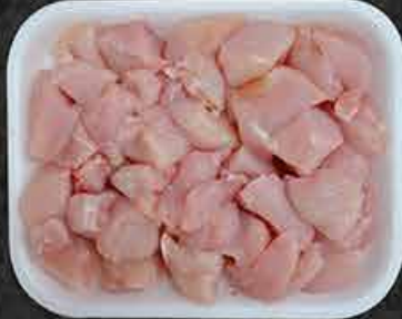
Kipfilet natuur blokjes Cubes de filet de poulet nature Kuşbaşı tavuk göğsü