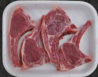
Lamskotelet Côtelettes d'agneau Kuzu Pirzola