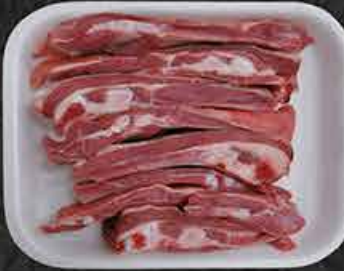
Lamsribben Basses-côtes d'agneau Kuzu kaburga