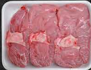
Kalfsschenkel Osso bucco Süt dana çorbalık