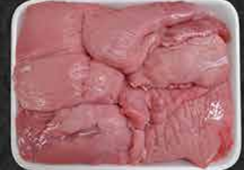
Kalfsstoofvlees Carbonades de veau Süt dana kuşbaşı