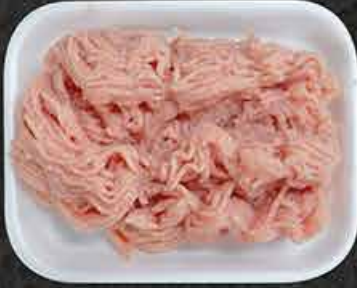
Kippengehakt Haché de poulet Tavuk kıyması