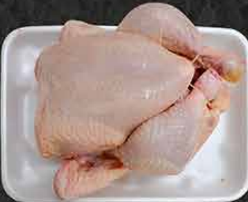
Hele kip Poulet entier Tüm Tavuk