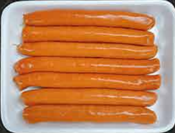
Kippenmerguez Merguez de poulet Tavuk mergez