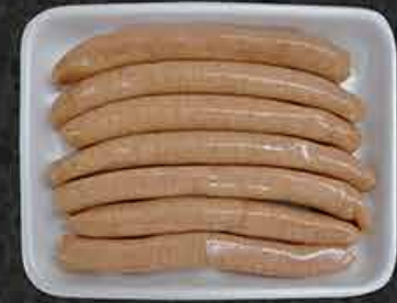
Kippenworsten Saucisses de poulet Tavuk sosıs