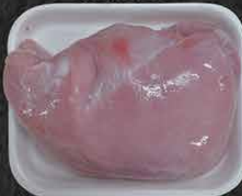
Kalkoenfilet Filets de dinde Hindi Fileto