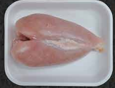
Kipfilet heel Filets de poulet Tavuk göğsü