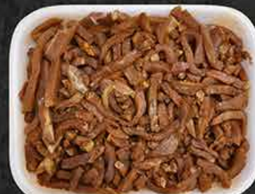
Kalkoenshoarma gekruid Shoarma de dinde avec épices Marine hindi shoarma