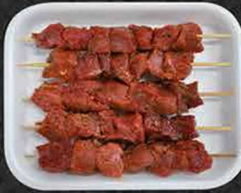
Runderbrochette Brochettes de bœuf Dana şiş