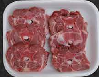
Lamsnek Cous d'agneau Kuzu boyun