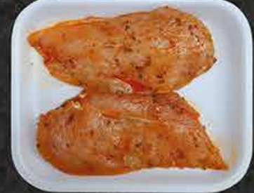
Kipfilet heel gemarineerd Filets de poulet - une pièce marinés Marine tavuk göğsü