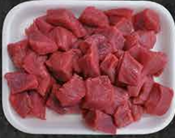
Stoofvlees gewoon Carbonades de bœuf Dana kuşbaşı