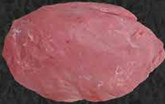
Kalbsbiefstuk Beefsteak de veau Süt dana biftek