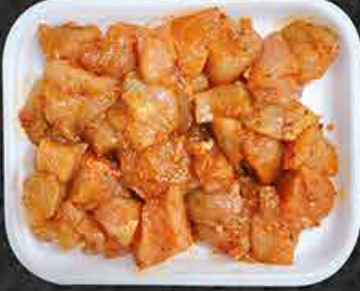
Kipfilet blokjes gemarineerd Cubes de filet de poulet marinés Marine kuşbaşı tavuk