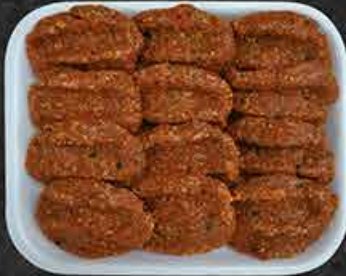
Köfte Köfte Köfte