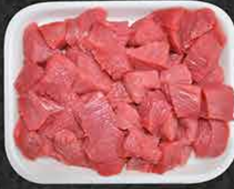
Stoofvlees ex. mals Carbonades de bœuf extra Dana kuşbaşı ekstra