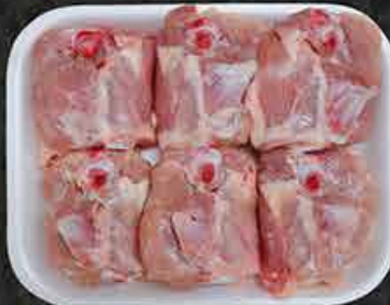
Kippen kotelet Cotelettes de poulet Tavuk pizola