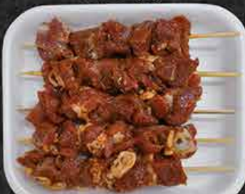
Lamsbrochette Brochettes d'agneau Kuzu şiş