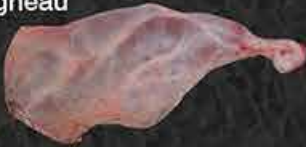
Lamsbout Jarret d'agneau Kuzu but