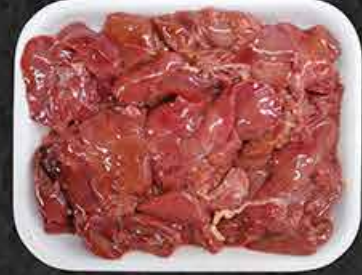
Kippenlevers Foies de poulet Tavuk ciğer