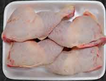
Kippenbout Cuisse de poulet Tavuk budu