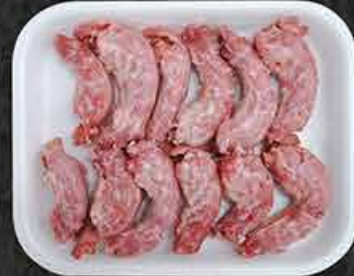
Kippennekken Cous de poulet Tavuk boyun