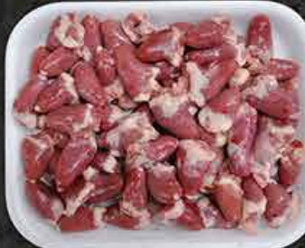
Kippenharten Cœurs de poulet Tavuk yürek