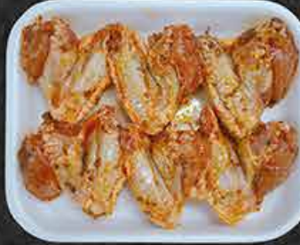
Kippenvleugels gemarineerd Ailes de poulet marinées Marine tavuk kanat