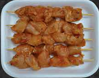
Kippensatés gemarineerd Brochettes de poulet marinées Marine tavuk şiş