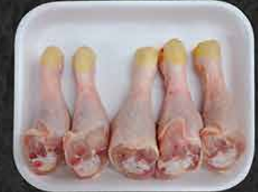
Kippendrumsticks Pilons de poulet Tavuk incik