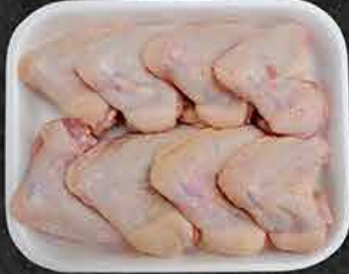
Kippenvleugels Ailes de poulet Tavuk kanadı