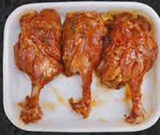
Kipkotelet gemarineerd Côtelettes de poulet marinées Marine tavuk pizola