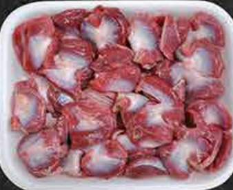
Kippenmagen Gésiers de poulet Tavuk Taşlık